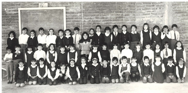
Primero Básico de 1977

El año 2016 la organización se transforma legalmente en la Fundación Red de Colegios SEG, haciéndose cargo del proyecto educativo con el desafío de ofrecer a los estudiantes aprendizajes de calidad que les permitan elegir su futuro. Para eso, la Fundación se ha centrado en fortalecer una cultura escolar de buen trato y altas expectativas, con altos niveles de desarrollo profesional docente, observación y retroalimentación continua en la sala de clases, análisis de resultados de aprendizaje y diseño de procesos de re-enseñanza.